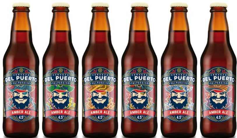
Etiquetas impresas utilizando Mosaic de HP Smartstream Designer.